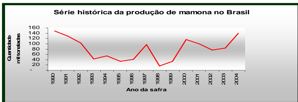
Figura 1. Série histórica da produção de mamona no Brasil

Essa região já foi responsável por 96,9% da produção dessa oleaginosa no país. Porém houve redução na sua produção devida há alguns fatores como a falta de sementes geneticamente melhoradas, emprego de práticas inadequadas, desorganização do mercado interno tanto para o produtor como consumidor entre outros. As figuras abaixo mostram a produção de mamona no Brasil e o Rendimento Médio no período de 1990 a 2004.