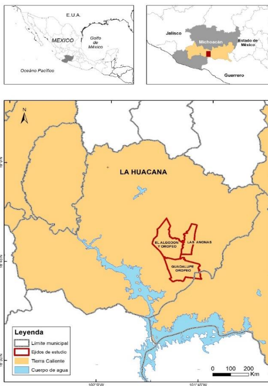
Ilustración 1. Ubicación geográfica de la región conocida como “Tierra caliente”